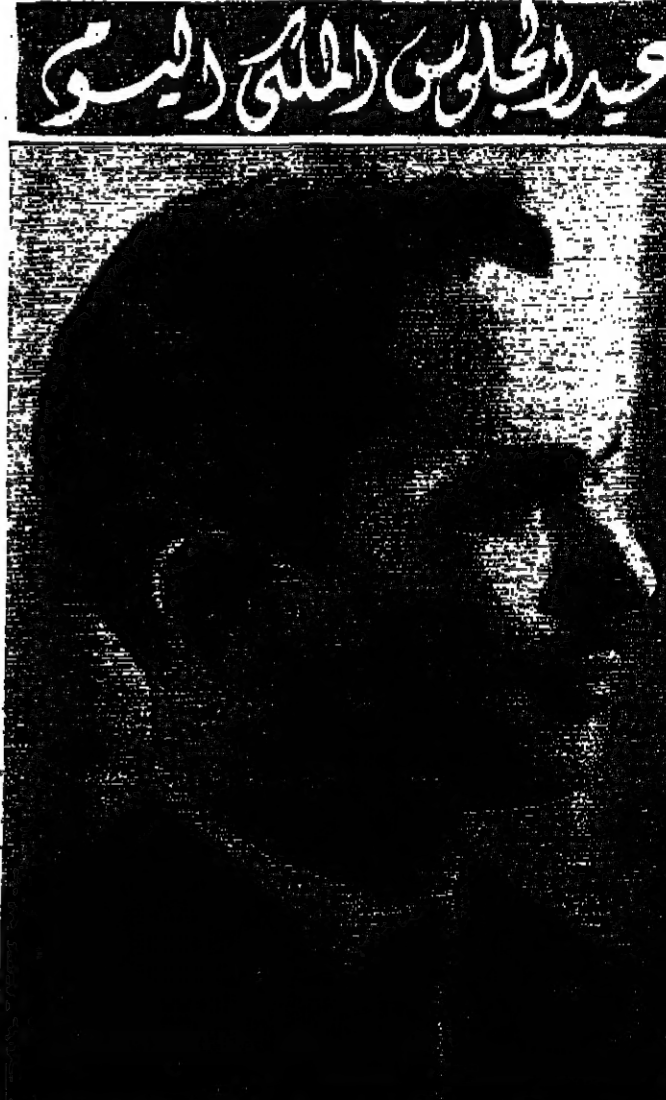
عمان - احتفل الملكة الأردنية الهاشمية اليوم «الإحد» بالذكرى السنوية الخامسة عشرة لاجتياز جلالته الملك العظيم على عرش المملكة واحتفاء بهذه المناسبة الكريمة أصدر جلالة السيد بهجت القادوني رئيس الوزراء بلافا بتعيين الوزراء والمؤسسات الرسمية.

على الصعيد الامم المتحدة - رويتر - اعتراف مسؤولون اسرائيليون هنا عن غضبهم لقرار بونتلان العام للامم المتحدة الذهاب الى الجزائر لعضو منظمة الوحدة العربية في الشهر القادم في الوقت الذي تحذر فيه الجزائر طاعة ركاب اسرائيلية. وقال المسؤولون الاسرائيليون انهم معززون ان يهجموا كيف يستطيع بونتلان ان يذهب الى الجزائر لافتتاح المؤتمر في الوقت الذي نفيس فيه الحكومة الجزائرية في «عمل فرصة» على حدسهم. باريس - أ.ب. - رفض المسؤولون الجزائريون مرة أخرى مقابلة مندوبين من جمعية الخطوط الجوية العالمية البقية على الصفحة الخامسة عمود 1